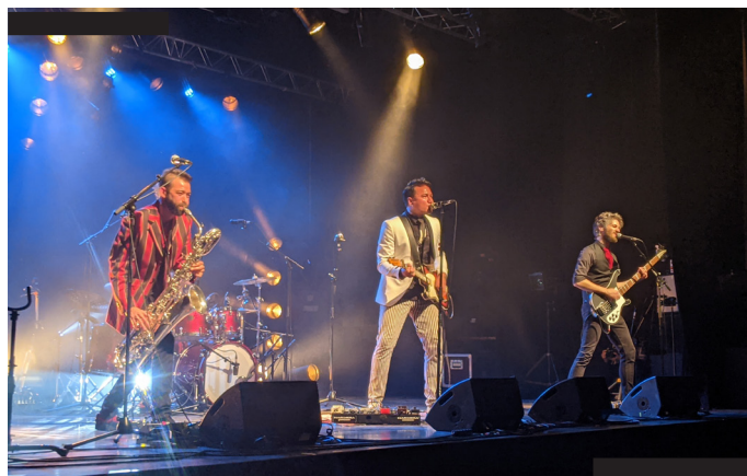
Nadejda - Résidence Ô Totem Live, 2021

Le temps de la résidence, la salle et son équipe technique sont mis à disposition des artistes, afin de leur permettre de travailler dans des conditions scéniques optimales . Enfin, les résidences font généralement l'objet d'une contrepartie (concert, action culturelle mis en place en fin de résidence ou plus tard dans l'année) ou bien d'une mise à disposition selon un tarif fixé sur demande. Les résidences font soit l'objet d'une contrepartie : concert ou action culturelle offerts, soit d'une mise à disposition (tarif sur demande).